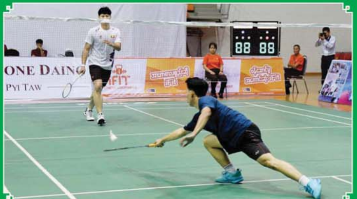
ပြည်နယ်နှင့် တိုင်းဒေသကြီး အမျိုးသားကြက်တောင်ရိုက်ပြိုင်ပွဲတွင် ကချင်ပြည်နယ်အသင်းနှင့် ရှမ်းပြည်နယ်အသင်းတို့ ယှဉ်ပြိုင်ကစားကြစဉ်။