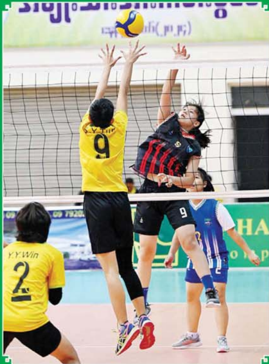
ပြည်နယ်နှင့် တိုင်းဒေသကြီး အမျိုးသားဘော်လီဘောပြိုင်ပွဲတွင် ရခိုင်ပြည်နယ် အသင်းနှင့် ကချင်ပြည်နယ်အသင်းတို့ ယှဉ်ပြိုင်ကစားကြစဉ်။