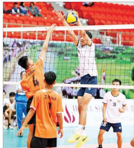
ပြည်နယ်နှင့်တိုင်းဒေသကြီး အမျိုးသားဘောလီဘောပြိုင်ပွဲတွင် ရခိုင်ပြည်နယ်အသင်းနှင့် ဧရာဝတီတိုင်းဒေသကြီးအသင်းတို့ ယှဉ်ပြိုင်ကစားကြစဉ်။

ပဲခူးတိုင်းဒေသကြီးအသင်းကို ၁၁၁ မှတ်အသွင်းဖြင့်လည်းကောင်း၊ အမျိုးသမီး ခရစ်ကက်ပြိုင်ပွဲတွင် ရခိုင်ပြည်နယ်အသင်းက ဧရာဝတီတိုင်းဒေသကြီး အသင်းကို သုံးယောက်အသွင်း၊ ကရင်ပြည်နယ်အသင်းက ပြည်ထောင်စုနယ်မြေ နေပြည်တော်အသင်းကို ခြောက်ယောက်အသွင်း၊ ပဲခူးတိုင်းဒေသကြီးအသင်းက မကွေးတိုင်းဒေသကြီးအသင်းကို နှစ်ယောက်အသွင်း၊ မန္တလေးတိုင်းဒေသကြီးအသင်းက မွန်ပြည်နယ်အသင်းက မန္တလေးတိုင်းဒေသကြီးအသင်းကို တစ်ယောက်အသွင်းဖြင့် လည်းကောင်း အနိုင်ရရှိခဲ့ကြသည်။ ပြည်နယ်နှင့် တိုင်းဒေသကြီး ဂေါက်သီးရိုက်ပြိုင်ပွဲကို ဖြူတော်ဂေါက်ကွင်း၌ကျင်းပရာ တစ်ဦးချင်းပြိုင်ပွဲ (အကျောမဲ့)၊ တစ်ဦးချင်းပြိုင်ပွဲ (အကျောပေး)၊ အသင်းလိုက်ပြိုင်ပွဲ (အကျောမဲ့) နှင့် အသင်းလိုက်ပြိုင်ပွဲ (အကျောပေး) ပြိုင်ပွဲများကို ပြည်ထောင်စုနယ်မြေ နေပြည်တော်အပါအဝင် ပြည်နယ်နှင့်တိုင်းဒေသကြီးများမှ ပြိုင်ပွဲဝင်များ ဝင်ရောက်ယှဉ်ပြိုင်ခဲ့ကြသည်။ ပြည်နယ်နှင့် တိုင်းဒေသကြီး အမျိုးသား၊ အမျိုးသမီး လက်စွဲပြိုင်ပွဲကို ဝဏ္ဏသိဒ္ဓိအားကစားကွင်း လက်စွဲရေ၌ ကျင်းပရာ အမျိုးသား