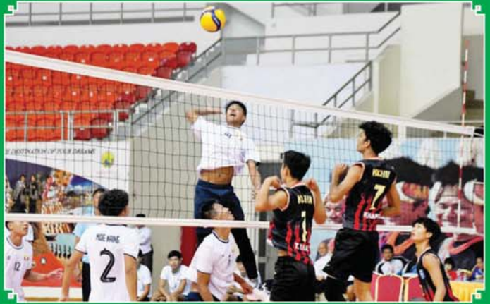
ပြည်နယ်နှင့် တိုင်းဒေသကြီး အမျိုးသားဘော်လီဘောပြိုင်ပွဲတွင် ရှမ်းပြည်နယ်အသင်းနှင့် ကချင်ပြည်နယ်အသင်းတို့ ယှဉ်ပြိုင်ကစားကြစဉ်။