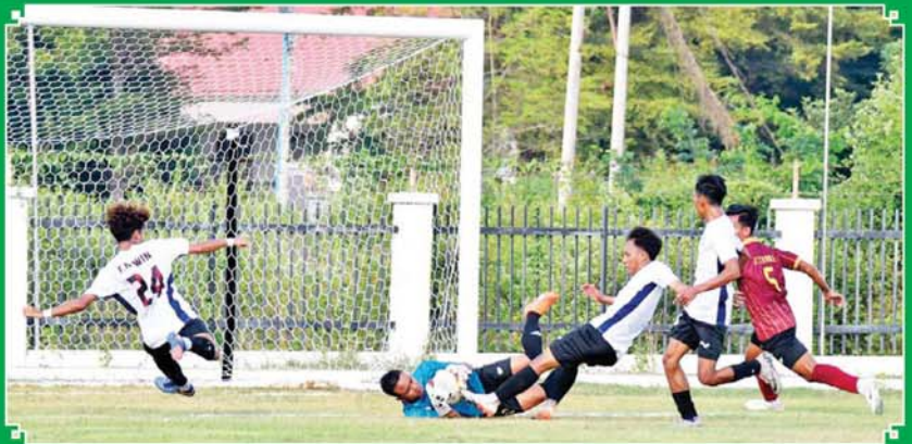
ဝန်ကြီးဌာန အလွတ်တန်းဘောလုံးပြိုင်ပွဲတွင် ကာကွယ်ရေးဝန်ကြီးဌာနအသင်းနှင့် သာသနာရေးနှင့်ယဉ်ကျေးမှုဝန်ကြီး ဌာနအသင်းတို့ ယှဉ်ပြိုင်ကစားကြစဉ်။