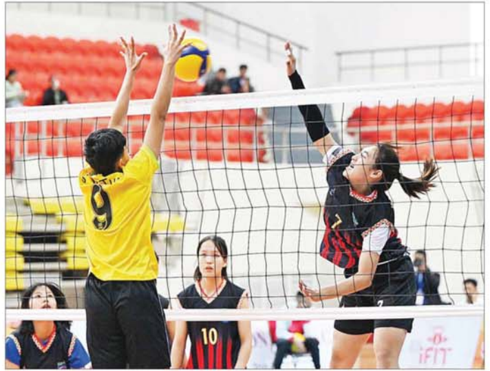
ပြည်နယ်နှင့်တိုင်းဒေသကြီး အမျိုးသားပိုက်ကျော်ခြင်းပြိုင်ပွဲတွင် ရခိုင်ပြည်နယ်အသင်းနှင့် ရှမ်းပြည်နယ်အသင်းတို့ ယှဉ်ပြိုင်ကစားကြစဉ်။