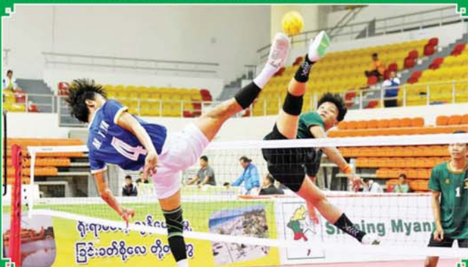
ပြည်နယ်နှင့် တိုင်းဒေသကြီး အမျိုးသားရိုက်ကျော်ခြင်းပြိုင်ပွဲတွင် ရန်ကုန်တိုင်းဒေသကြီးအသင်းနှင့် မွန်ပြည်နယ်အသင်းတို့ ယှဉ်ပြိုင်ကစားကြစဉ်။