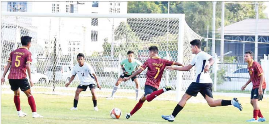
ဝန်ကြီးဌာနပေါင်းစုံ အလွတ်တန်းအမျိုးသားဘောလုံးပြိုင်ပွဲတွင် ကာကွယ်ရေးဝန်ကြီးဌာနအသင်းနှင့် သာသနာရေးနှင့် ယဉ်ကျေးမှုဝန်ကြီးဌာနအသင်းတို့ ယှဉ်ပြိုင်ကစားကြစဉ်။

ဝန်ကြီးဌာနအသင်းက လျှပ်စစ်စွမ်းအားဝန်ကြီးဌာန အသင်းကို နှစ်စဉ် - ဝိုးမရှိဖြင့်လည်းကောင်း၊ ကာကွယ်ရေးဝန်ကြီးဌာနအသင်းက သာသနာရေးနှင့်ယဉ်ကျေးမှုဝန်ကြီးဌာနအသင်းကို ခြောက်ရိုး-တစ်ရိုးဖြင့်လည်းကောင်း၊ ပြည်ထဲရေးဝန်ကြီးဌာန အသင်းက တိုင်းရင်းသား လူမျိုးများရေးရာဝန်ကြီးဌာနအသင်းကို ခြောက်ရိုး-တစ်ရိုးဖြင့်လည်းကောင်း အနိုင်ရရှိခဲ့ကြသည်။ ယနေ့ကျင်းပသည့် အားကစားပြိုင်ပွဲများသို့ ပြည်ထောင်စုအဆင့်ပုဂ္ဂိုလ်များ၊ ဒုတိယဝန်ကြီးများ၊ တိုင်းဒေသကြီးနှင့် ပြည်နယ်ဝန်ကြီးများ၊ ဌာနဆိုင်ရာများ၊ အားကစားနည်းအလိုက် အုပ်စုများမှ တာဝန်ရှိသူများ၊ ဝန်ထမ်းများ၊ ကျောင်းသား ကျောင်းသူများနှင့် အားကစားဝါသနာရှင်ပြည်သူများ စိတ်ပါဝင်စားစွာ လာရောက်ကြည့်ရှု အားပေးကြသည်။ ပဉ္စမအကြိမ် အမျိုးသားအားကစားပွဲတော်ဆုတံဆိပ်များ ရရှိမှုအနေဖြင့် ပြည်နယ်နှင့် တိုင်းဒေသကြီး အားကစားပြိုင်ပွဲများတွင် စစ်ကိုင်းတိုင်းဒေသကြီးက ရွှေတစ်ခု၊ မွန်ပြည်နယ်က ရွှေတစ်ခု၊ ကရင်ပြည်နယ်က ရွှေတစ်ခု၊ ရခိုင်ပြည်နယ်အသင်းက ရွှေတစ်ခု၊ ရန်ကုန်တိုင်းဒေသကြီးက ကြေးတစ်ခုနှင့် မန္တလေးတိုင်းဒေသကြီးက ကြေးတစ်ခု၊ မသန်စွမ်းအားကစားနည်းပြိုင်ပွဲများတွင် ဧရာဝတီတိုင်းဒေသကြီးက ရွှေ ၁၁ ခု၊ ငွေ ၄၁ ခု၊ ကြေး ၁၁ ခု၊ ပဲခူးတိုင်းဒေသကြီးက ရွှေ ၅ ခု၊ ငွေ ၄ ခု၊ ကြေး ၃ ခု၊ ရန်ကုန်တိုင်းဒေသကြီးက ရွှေ ၃ ခု၊ ငွေ ၃ ခု၊ ကြေး ၁ ခု၊ မန္တလေးတိုင်းဒေသကြီးက ရွှေလေးခု၊ ငွေကိုးခု၊ ကြေး ၁၁ ခု၊ မွန်ပြည်နယ်က ရွှေလေးခု၊ ငွေ ၃ ခု၊ မွန်ပြည်နယ်က ရွှေလေးခု၊ ငွေ ၃ ခု၊ ကြေးလေးခု၊ ပြည်ထောင်စုနယ်မြေနေပြည်တော်က ရွှေလေးခု၊ ငွေ ၄ ခု၊ ကြေးခြောက်ခုတို့ကို ဆွတ်ခူးရရှိထားကြကြောင်း သိရသည်။