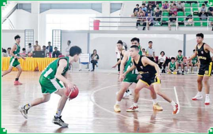
ပြည်နယ်နှင့် တိုင်းဒေသကြီး အမျိုးသားဘတ်စကက်ဘောပြိုင်ပွဲတွင် ရန်ကုန်တိုင်းဒေသကြီး အသင်းနှင့် မန္တလေးတိုင်းဒေသကြီးအသင်းတို့ ယှဉ်ပြိုင်ကစားကြစဉ်။