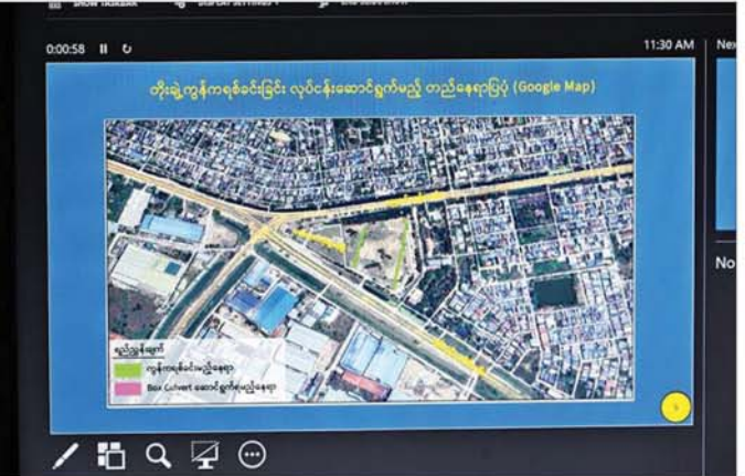
တိုးချဲ့ကုန်ကရိမ်ငါးခြင်း လုပ်ငန်းဆောင်ရွက်မည့် တည်နေရာပြပုံ (Google Map)