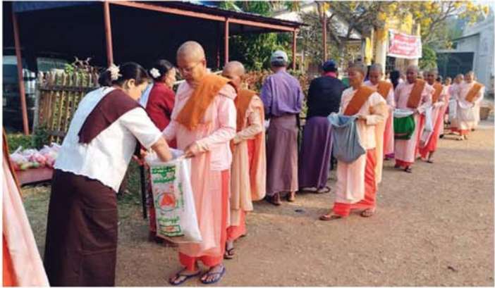
လျက်ရှိရာ အကြိမ်(၉၀)မြောက် လောင်းလှူပွဲတွင် မြို့ပေါ်ကျောင်းတိုက် အသီးသီးမှ သီလရှင် ၆၅ ပါးအား ဆွမ်းဆန်တော်၊ ဆီ၊ ဆား၊ ဆေးနှင့် ဝတ္ထုငွေ အသုံး

မကွေးတိုင်းဒေသကြီး၊ သရက်မြို့၌ လစဉ် လပြည့်နေ့ တိုင်း လှူဒါန်းလျက်ရှိသည့် (၉၀) ကြိမ်မြောက် သာသနာ့အဖွဲ့ဝင် သီလရှင် ၆၅ ပါးအား ဆွမ်းဆန်တော်နှင့် အလှူငွေ လောင်းလှူပွဲကို ယနေ့ နံနက် ၈ နာရီက ပြည်တော်အေးရပ်ကွက်၊ ဆင်ဖြူတော်ဘုန်းတော်ကြီးကျောင်းတွင် ကျင်းပသည်။