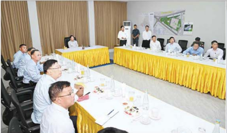
နိုင်ငံတော်စီမံအုပ်ချုပ်ရေးကောင်စီဥက္ကဋ္ဌ နိုင်ငံတော်ဝန်ကြီးချုပ် ဗိုလ်ချုပ်မှူးကြီးမင်းအောင်လှိုင်အား လှိုင်သာယာမြို့နယ်ရှိ ဘုရင့်နောင်ပန်းခြံရှင်းလင်းဆောင်ခန်းမ၌ ရန်ကုန်တိုင်းဒေသကြီးဝန်ကြီးချုပ်က ရှင်းလင်းတင်ပြစဉ်။

နှင့် အခြားလိုအပ်သည်များကို မှာကြားသည်။ ထို့နောက် နိုင်ငံတော်စီမံအုပ်ချုပ်ရေးကောင်စီဥက္ကဋ္ဌ နိုင်ငံတော်ဝန်ကြီးချုပ်သည် လှိုင်သာယာမြို့နယ်အတွင်း ရေစီးရေလာကောင်းမွန်စေရေး ဆောင်ရွက်ထားရှိမှု အခြေအနေများကို လိုက်လံကြည့်ရှုစစ်ဆေးပြီး တာဝန်ရှိသူများ၏ တင်ပြချက်များအပေါ် လိုအပ်သည်များ လမ်းညွှန်မှာကြားခဲ့ကြောင်း သိရသည်။ သတင်းစဉ်