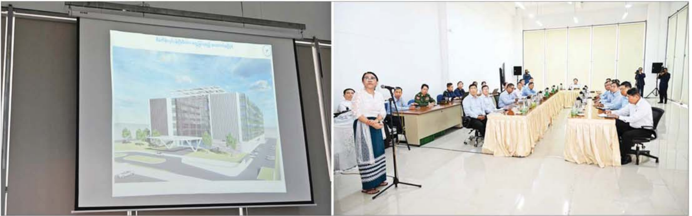
နိုင်ငံတော်စီမံအုပ်ချုပ်ရေးကောင်စီဥက္ကဋ္ဌ နိုင်ငံတော်ဝန်ကြီးချုပ် ဗိုလ်ချုပ်မှူးကြီးမင်းအောင်လှိုင်အား သတင်းအချက်အလက် နည်းပညာတက္ကသိုလ်ပါမောက္ခချုပ် ဒေါက်တာစောစန္ဒာအေးက ရှင်းလင်းတင်ပြစဉ်။

၀ ရှေ့မှစ၍ နည်းပညာဝန်ကြီးဌာန အဆင့်မြင့်သိပ္ပံနှင့် နည်းပညာဦးစီးဌာန သတင်းအချက် အလက်နည်းပညာ တက္ကသိုလ်သို့ရောက်ရှိကြရာ တာဝန်ရှိသူများက ကြိုဆိုနှုတ်ဆက်ကြသည်။ ထို့နောက် တက္ကသိုလ်အစည်းအဝေးခန်းမတွင် တက္ကသိုလ်ပါမောက္ခချုပ် ဒေါက်တာစောစန္ဒာအေးက ရန်ကုန် ကွန်ပျူတာတက္ကသိုလ်ကို သတင်းအချက်အလက်နည်းပညာ တက္ကသိုလ်အဖြစ် ပြောင်းလဲခဲ့မှုနှင့် တက္ကသိုလ်၏ သမိုင်းကြောင်းဆိုင်ရာ အချက်အလက်များ၊ ဖွဲ့စည်းပုံ၊ ဘာသာရပ်အလိုက်၊ ပညာသင် နှစ်အလိုက် သင်ကြားပေးလျက်ရှိမှု၊ ပြည်ပ တွဲလွန်သင်တန်း တက်ရောက်ရန် ပညာတော်သင်များ ရွေးချယ်စေလွှတ်လျက်ရှိမှု၊ တိုင်းဒေသ ကြီးနှင့် ပြည်နယ်အလိုက် ကျောင်းသား ကျောင်းသူများ တက်ရောက်ပညာသင် ကြားလျက်ရှိမှု၊ နည်းပညာအသုံးပြု သင်ကြားသင်ယူမှုနှင့် စီမံခန့်ခွဲမှုစနစ်ဖြင့် သင်ကြားပေးလျက်ရှိမှု၊ ကျောင်းသား ကျောင်းသူများ လုပ်ငန်းခွင်သင်တန်း စေလွှတ်မှုနှင့် အလုပ်အကိုင်ရရှိမှု၊ International Conference on Advanced Information Technologies (ICAIT) တွင် စာတမ်းများ တင်သွင်းနိုင်မှု၊ သတင်းအချက်အလက် နည်းပညာ