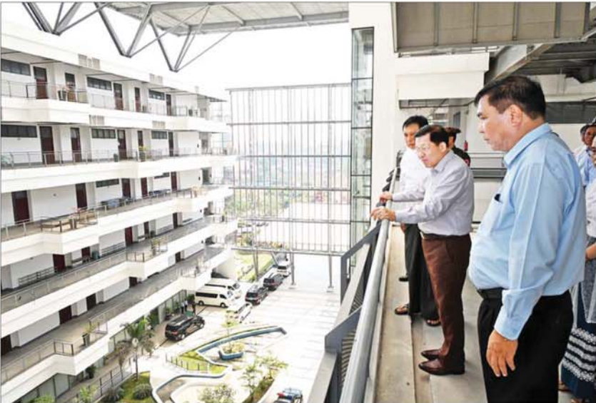
နိုင်ငံတော်စီမံအုပ်ချုပ်ရေးကောင်စီဥက္ကဋ္ဌ နိုင်ငံတော်ဝန်ကြီးချုပ် ဗိုလ်ချုပ်မှူးကြီးမင်းအောင်လှိုင် သတင်းအချက် အလက် နည်းပညာတက္ကသိုလ်အတွင်း ကြည့်ရှုစစ်ဆေးစဉ်။

၀ ရှေ့မှစ၍ နည်းပညာဝန်ကြီးဌာန အဆင့်မြင့်သိပ္ပံနှင့် နည်းပညာဦးစီးဌာန သတင်းအချက် အလက်နည်းပညာ တက္ကသိုလ်သို့ရောက်ရှိကြရာ တာဝန်ရှိသူများက ကြိုဆိုနှုတ်ဆက်ကြသည်။ ထို့နောက် တက္ကသိုလ်အစည်းအဝေးခန်းမတွင် တက္ကသိုလ်ပါမောက္ခချုပ် ဒေါက်တာစောစန္ဒာအေးက ရန်ကုန် ကွန်ပျူတာတက္ကသိုလ်ကို သတင်းအချက်အလက်နည်းပညာ တက္ကသိုလ်အဖြစ် ပြောင်းလဲခဲ့မှုနှင့် တက္ကသိုလ်၏ သမိုင်းကြောင်းဆိုင်ရာ အချက်အလက်များ၊ ဖွဲ့စည်းပုံ၊ ဘာသာရပ်အလိုက်၊ ပညာသင် နှစ်အလိုက် သင်ကြားပေးလျက်ရှိမှု၊ ပြည်ပ တွဲလွန်သင်တန်း တက်ရောက်ရန် ပညာတော်သင်များ ရွေးချယ်စေလွှတ်လျက်ရှိမှု၊ တိုင်းဒေသ ကြီးနှင့် ပြည်နယ်အလိုက် ကျောင်းသား ကျောင်းသူများ တက်ရောက်ပညာသင် ကြားလျက်ရှိမှု၊ နည်းပညာအသုံးပြု သင်ကြားသင်ယူမှုနှင့် စီမံခန့်ခွဲမှုစနစ်ဖြင့် သင်ကြားပေးလျက်ရှိမှု၊ ကျောင်းသား ကျောင်းသူများ လုပ်ငန်းခွင်သင်တန်း စေလွှတ်မှုနှင့် အလုပ်အကိုင်ရရှိမှု၊ International Conference on Advanced Information Technologies (ICAIT) တွင် စာတမ်းများ တင်သွင်းနိုင်မှု၊ သတင်းအချက်အလက် နည်းပညာ