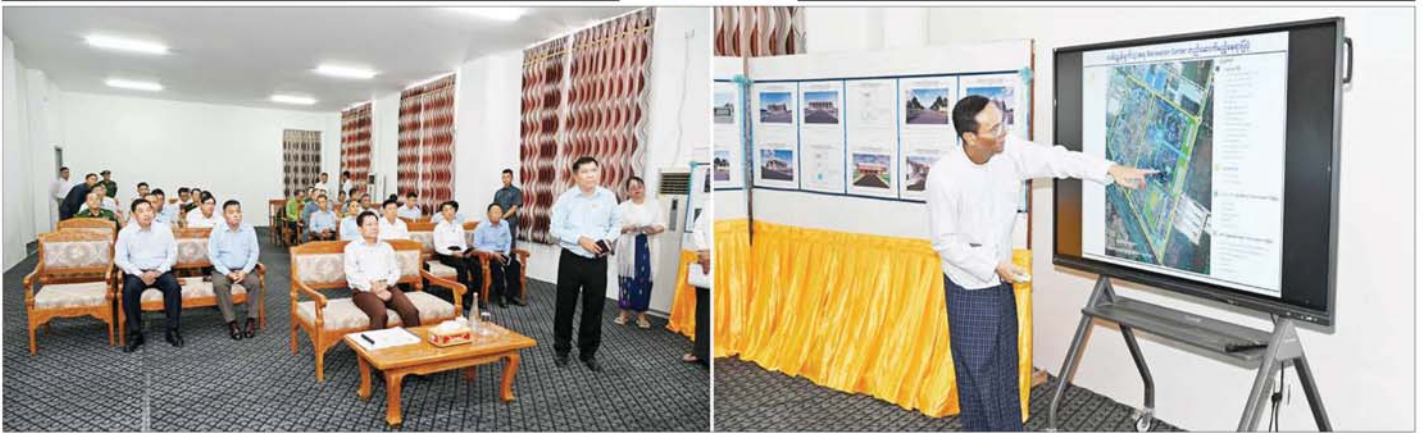
နိုင်ငံတော်စီမံအုပ်ချုပ်ရေးကောင်စီဥက္ကဋ္ဌ နိုင်ငံတော်ဝန်ကြီးချုပ် ဗိုလ်ချုပ်မှူးကြီးမင်းအောင်လှိုင်အား လှိုင်သာယာမြို့နယ်ရှိ ရန်ကုန်အနောက်ပိုင်းနည်းပညာတက္ကသိုလ်၌ မါမောက္ခချုပ် ဒေါက်တာကြည်စိုးက ရှင်းလင်းတင်ပြစဉ်။

စာမျက်နှာ ၃ မှ ယင်းနောက် နိုင်ငံတော်စီမံအုပ်ချုပ်ရေးကောင်စီဥက္ကဋ္ဌ နိုင်ငံတော်ဝန်ကြီးချုပ်သည် ပင်မသုံးထပ်စာသင်ဆောင်အသစ် တည်ဆောက်ပြီးစီးမှုအခြေအနေများ၊ ကျောင်းဝင်းအတွင်းရှိ စာသင်ဆောင်များနှင့် ပွဲကြည့်စင်နှင့် ပြေးလမ်းပါဘောလုံးကွင်း တည်ဆောက်နေမှုအခြေအနေများကို လိုက်လံကြည့်ရှုစစ်ဆေးပြီး တာဝန်ရှိသူများ၏ တင်ပြချက်များအပေါ် လိုအပ်သည်များလမ်းညွှန်မှာကြားသည်။