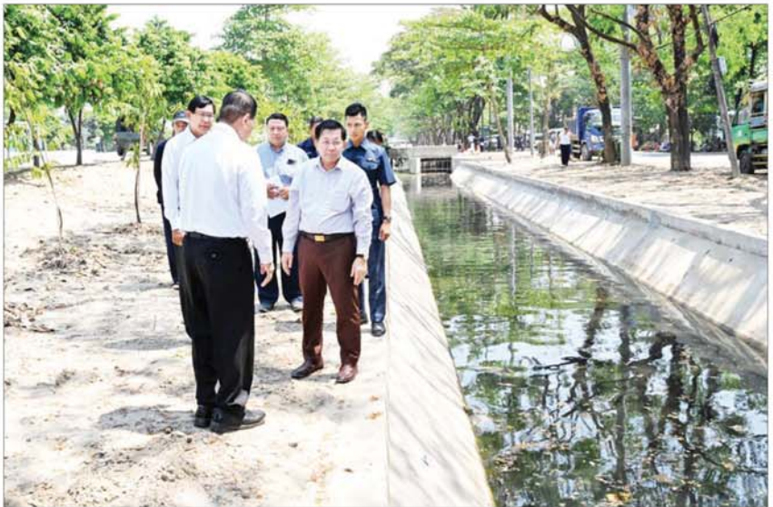
နိုင်ငံတော်စီမံအုပ်ချုပ်ရေးကောင်စီဥက္ကဋ္ဌ နိုင်ငံတော်ဝန်ကြီးချုပ် ဗိုလ်ချုပ်မှူးကြီးမင်းအောင်လှိုင် လှိုင်သာယာမြို့နယ်အတွင်း ရေစီးရေလာကောင်းမွန်စေရေး ဆောင်ရွက်ထားရှိမှုများကို ကြည့်ရှုစစ်ဆေးစဉ်။

ရှင်းလင်းတင်ပြမှုများအပေါ် နိုင်ငံတော် စီမံအုပ်ချုပ်ရေးကောင်စီဥက္ကဋ္ဌ နိုင်ငံတော်ဝန်ကြီးချုပ်က ယခင်နှစ် လာရောက်စစ်ဆေးစဉ် လှိုင်သာယာမြို့နယ်အတွင်း ရေစီးရေလာကောင်းမွန်စေရေး၊ လျှပ်စစ်စီးတိုင်များ စနစ်တကျ ရှိစေရေး ဆောင်ရွက်သွားရန်မှာကြားခဲ့ပြီး လုပ်ငန်းဆောင်ရွက်မှုများတွင် လိုအပ်ချက်များရှိနေသည်ကို တွေ့မြင်ရကြောင်း၊ ရေထွက်စနစ်များ စနစ်တကျ ကောင်းမွန်စေရေး ရေနုတ်မြောင်းများ၊ တံတားများကို သတ်မှတ်ချက်များနှင့်အညီ ရေစီးရေလာကောင်းမွန်အောင် ပြန်လည်ပြုပြင်ဆောင်ရွက်သွားရန် လိုကြောင်း၊ လှိုင်သာယာတွင် ရေစီးရေလာကောင်းမွန်ရေးသည် အဓိကပြေရှင်းဆောင်ရွက်ပေးရမည့် ကိစ္စတစ်ခုဖြစ်သဖြင့် အလေးထားဆောင်ရွက်သွားရန် လိုကြောင်း၊ တစ်မြို့နယ်လုံး အတိုင်းအတာဖြင့် ရေဝင်ရေထွက်ကောင်းမွန်ရမည်ဖြစ်ကြောင်း၊ မိုးရာသီကာလသို့ မရောက်ရှိမီ ရေစီးရေလာကောင်းမွန်စေရေးနှင့် ရေထွက်ပေါက်များ စနစ်တကျ