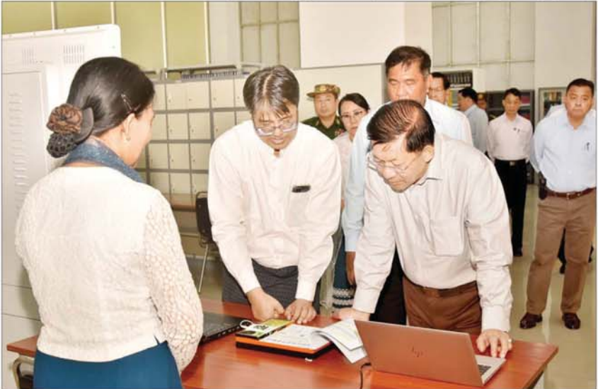
နိုင်ငံတော်စီမံအုပ်ချုပ်ရေးကောင်စီဥက္ကဋ္ဌ နိုင်ငံတော်ဝန်ကြီးချုပ် ဗိုလ်ချုပ်မှူးကြီးမင်းအောင်လှိုင် သတင်းအချက် အလက် နည်းပညာတက္ကသိုလ်တွင် ကြည့်ရှုစစ်ဆေးစဉ်။